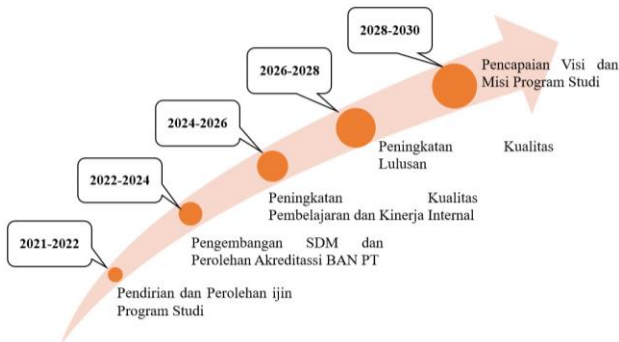
Gambar 2. Milestone Visi Prodi S1 Pendidikan Teknologi Informasi 2022 -2030